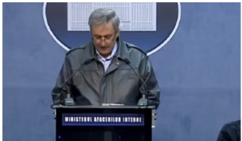
Șeful IGJR nu a avut aprobarea ministrului Vela de a-și băga sute de ore suplimentare la pontaj

Oare cum s-or simți jandarmii ținută în stradă de atâtea luni bune de zile și folosiți drept "carne de tun" la toate scandalurile între clanurile interlope și trimiși drept "săgeți" la cele mai riscante misiuni din timpul stărilor de urgență și alertă, aflând acum că șeful lor tocmai ce s-a căpătuit cu o leafă lunară de nici mai mult nici mai puțin de 35.000 lei? Sau cum s-or simți la rândul lor și ceilalți inspectori generali sau șefi ai altor structuri, care deși la rândul lor au băgat la greu "zi lumină" în toate aceste ultime luni, fără a le trece însă prin cap să se puncteze de unii singuri cu sute de ore suplimentare lunar.