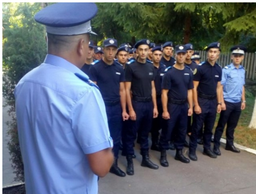
Oare jandarmii trimiși "carne de tun" pe stradă or ști cât încasează șeful lor?