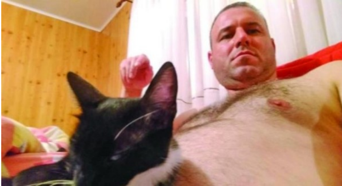
Colonelul Enescu, cel mai bine plătit bugetar din tot sistemul

Șoc total la vârful Ministerului Afacerilor Interne, după ce secretarul de stat Bogdan Despescu a intrat la rândul său în posesia informației cu privire la lefurile absolut halucinante pe care inspectorul general al Jandarmeriei Române, colonelul Bogdan Enescu le-ar fi încasat pentru ultimele trei luni. Mai mult decât atât, după cum reiese din informațiile noastre, DNA-ul militar așteaptă în orele următoarele "hârțile" oficiale de la MAI. Cele din care, după cum deja a fost informată conducerea ministerului, reiese că șeful IGJR, Bogdan "Mițu" Enescu ar figura pentru lunile aprilie, mai și iunie cu următoarele sume : 32.000 lei, 29.000 lei și 35.000 lei! Adică nu mai puțin de 350 milioane lei vechi pentru o singură lună!!!